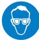
Usare occhiali protettivi