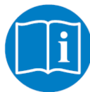
Leggere le Istruzioni