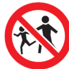
Tenere fuori dalla portata dei bambini