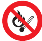
Non fumare, tenere lontano da fiamme libere e/o scintille

L'etichettatura potrebbe variare in funzione dell'applicazione e della dimensione della batteria. Il produttore, rispettivamente l'importatore delle batterie, è responsabile dell'applicazione dei seguenti simboli, in conformità con gli standard internazionali.