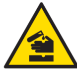
Pericolo: acido corrosivo