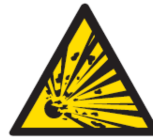
Pericolo di esplosione